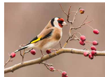
Stieglitz sitzt auf Wildrose