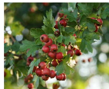
Rote Früchte des Weißdorns