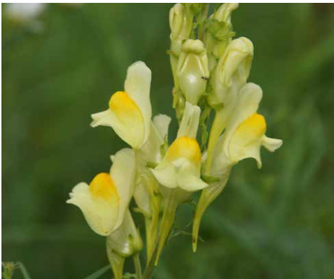
Echtes Leinkraut mit einer Spiegelebene