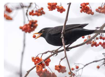
Amsel frisst Vogelbeere