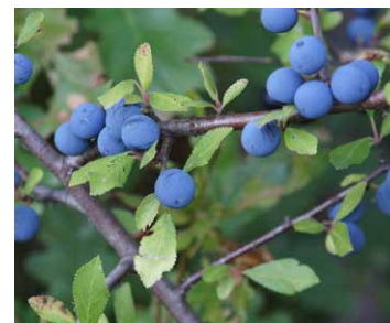
Früchte des Schlehdorns