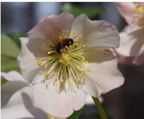
Die Schneerose hat gut erkennbare Staub- und Fruchtblätter.

Blüten sind die leuchtenden und attraktiven „Werbeschilder“ der Pflanzen. Mit verschiedensten Lockmitteln wie betörenden Düften, unübersehbaren Farbkombinationen, Wärmeerzeugung oder einem reichlichen Nahrungsangebot versuchen Pflanzen, Insekten in ihren Bann zu ziehen. Oft wartet eine vielversprechende Belohnung in Form von Nektar, Pollen, Harz oder Öl auf die angelockten Tiere. Manchmal aber auch nicht! Denn einige Pflanzen sind sehr raffiniert und täuschen mit Blütenmalen, Düften oder Behaarung Angebote vor, die es gar nicht gibt.